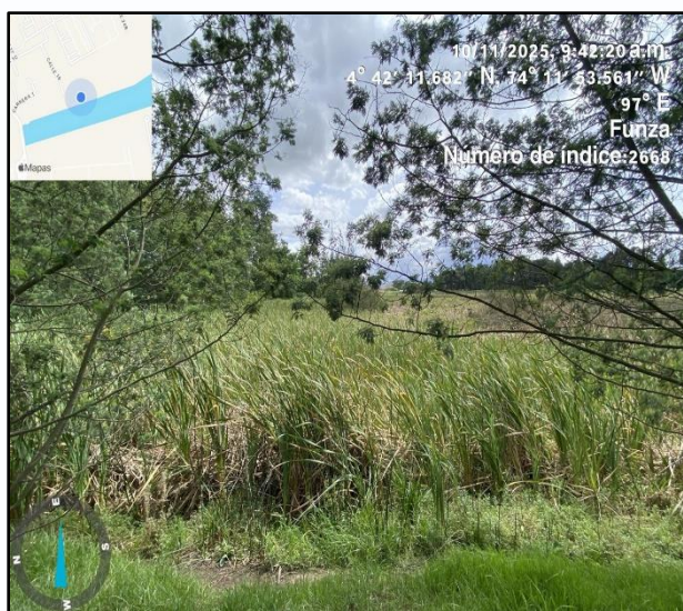
Ilustración 3. Evidencia recorrido punto 2