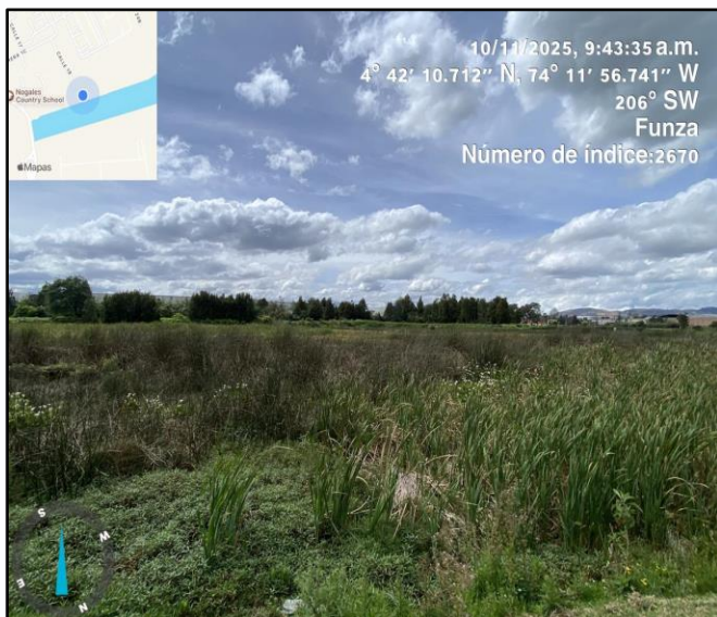
Ilustración 5. Evidencia recorrido punto 4

C.P 250020 Tel. (601) 8234070 823 40 71 / 823 40 73 Fax. (601) 8257620 Dir. Cra. 14 No. 13-05 03-FR-16 VER.11.2025