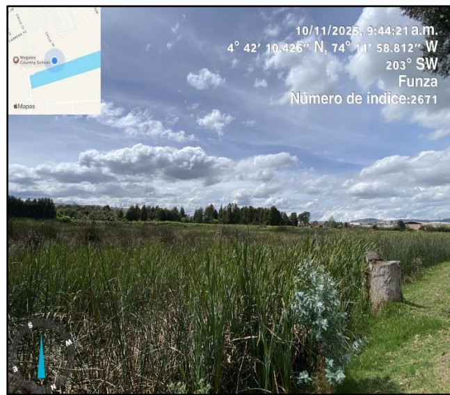
Ilustración 6. Evidencia recorrido punto 5

Elisón Ardila ELLISON ARDILA VASQUEZ Contratista CPS05992025