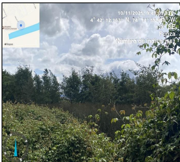
Ilustración 2. Evidencia recorrido punto 1

Dentro del recorrido de control y vigilancia en el humedal Guali, no se evidenció presencia de residuos, motobombas, ni semovientes que puedan afectar al ecosistema, ni actividades que alteren el entorno natural o la calidad del agua (ver ilustraciones 2,3, 4,5 y 6).