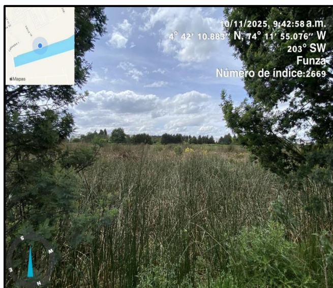
Ilustración 4. Evidencia recorrido punto 3